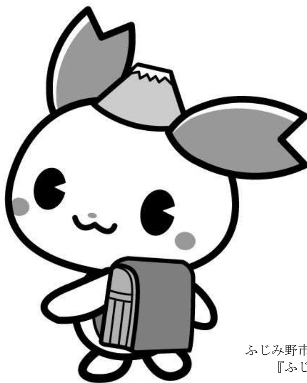
ふじみ野市PR大使 『ふじみん』